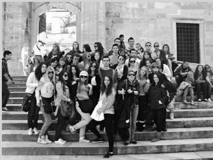
Stolačka i mostarska ekipa

Neopisiv je osjećaj gledati Istanbul dok se voziš brodom, i opuštaš se uz tihu tursku orijentalnu muziku. Ali morali smo krenuti dalje. Obišli smo i najveće tržne centre Istanbula koji su kao iz snova. Vrativši se u hotel opet nismo imali mira i nastavili smo sa sinoć prekinutom feštom.